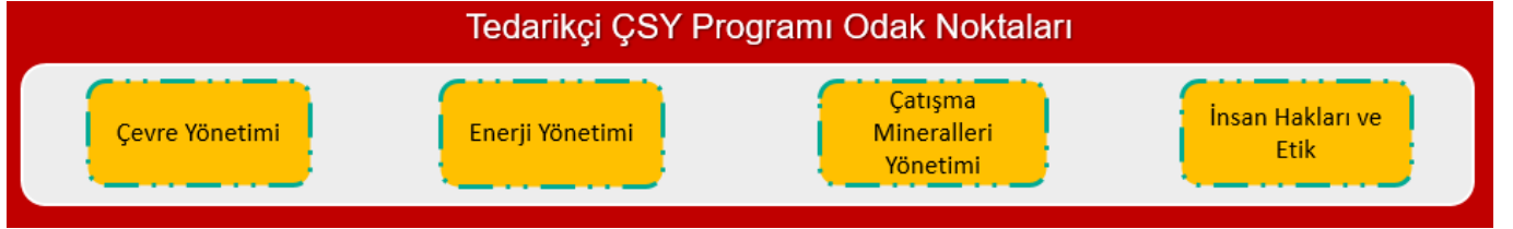
Şekil 3. Program Odak Noktaları

Programın genel görünümü Şekil 3'te verilmiştir: